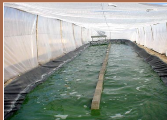
Reactor artesanal de 10.000 litros, bajo invernadero (F. y A. Ayala).