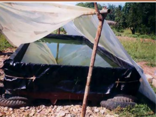
Cultivo artesanal (Kabinda, República Democrática del Congo).