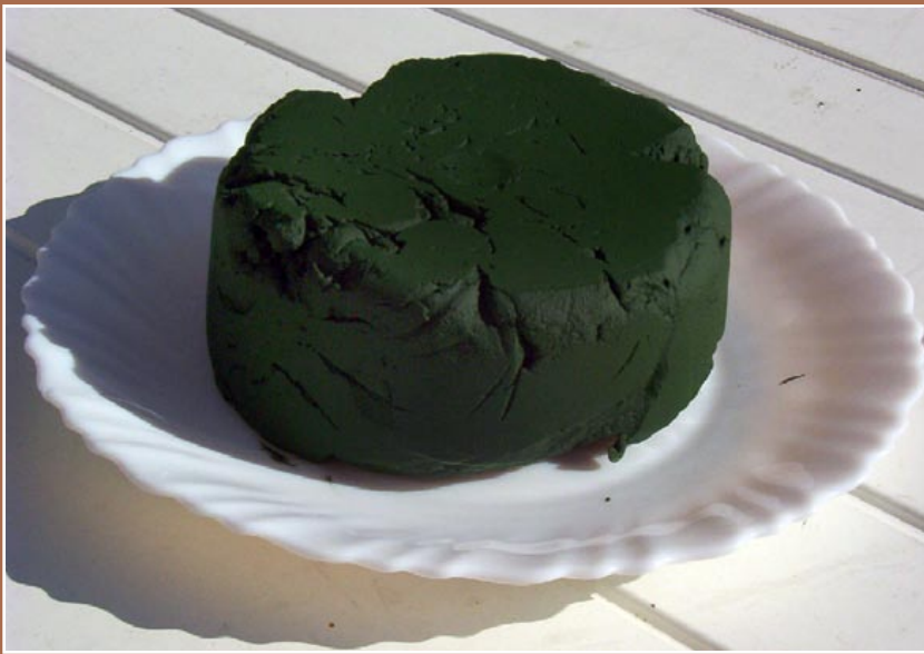
Concentrado de espirulina fresca.

Luminosidad: media sombra; nunca el sol directo.