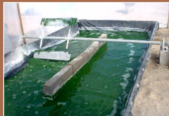
Reactor artesanal de 2.000 litros (F. y A. Ayala). La agitación del agua se hace manualmente, con dos palas que giran sobre un eje.