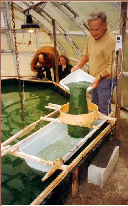
Cosecha por filtración (Mialet, Francia).