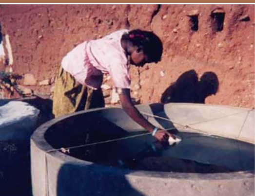
Cultivo artesanal (India).