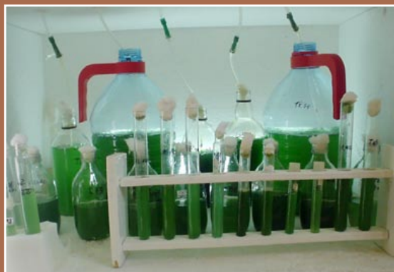
Incubadora casera para el mantenimiento de cepas de espirulina (F. y A. Ayala).

*Natural Waves Asesores. Para un mayor asesoramiento, el lector interesado puede dirigir sus consultas a fayalaj@natwaves.com