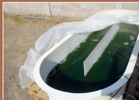
Reactor de fibra de vidrio de 500 litros (F. y A. Ayala).