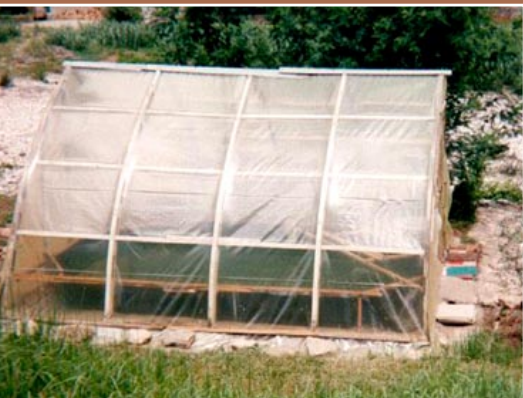
Cultivo en el jardín (Mialet, Francia).

El objetivo principal del trabajo 'en el jardín' es cultivar una pequeña cantidad de espirulina, que se pueda cosechar para el consumo doméstico.