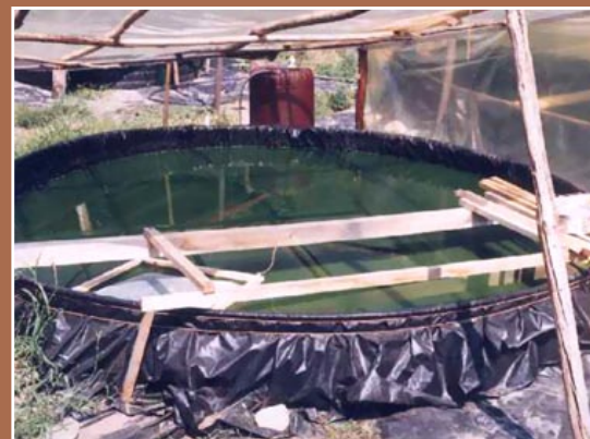
Cultivo en el jardín (Mialet, Francia).

Independientemente del contenedor de agua que se vaya a usar (que deberá ser poco profundo), este tiene que encontrarse limpio y desinfectado para su uso. La desinfección se puede hacer con algún detergente, procurando enjuagar muy bien antes de usarlo. No se recomienda el uso de cloro o productos en base a este, ya que es difícil retirar del envase con un solo enjuague. Los materiales recomendados pueden ser plásticos que resistan ácidos y bases fuertes, como son bidones para el agua envasada. También pueden ser de vidrio, pero solo en el caso de volúmenes pequeños, ya que mover un envase muy grande es dificultoso.