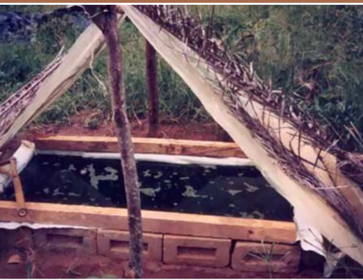
Cultivo artesanal (Masiapo, Perú).