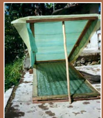
Secado solar de la espirulina (Masiapo, Perú).