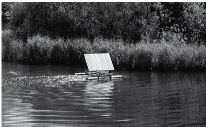
Depurador de aguas sistema Oloid movido con energía solar.

La tecnología se puede complementar con la sabiduría derivada de los conocimientos teosóficos. Una de las bases de la tecnología son los descubrimientos de Theodor Schwenk, autor del libro El caos sensible . Según Schwenk el agua tiene la capacidad de incorporar, a través del movimiento, distintos tipos de propiedades. Una de las influencias más grandes que tenemos es la de los planetas, y se puede determinar el día o el momento del día más apropiado para activar el agua. Es como con la agricultura biodinámica, que define cuáles son los momentos oportunos para realizar las distintas tareas agrícolas. Y es que no sólo hay que hablar de fuerzas que activan el agua sino también de qué fuerzas son. OLOID AG tiene muy claro cuáles son estas fuerzas y cómo actúan.