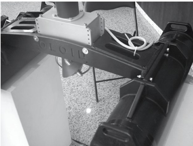
El Oloid (asomando por debajo) aplicado a una estructura.

Tobias Langscheid heredó de su abuelo (Paul Schatz) el interés por las formas de los cuerpos geométricos, la fascinación por la investigación y los nuevos descubrimientos. Las cualidades del Oloid como mezclador de fluidos lo han consolidado tal vez como el mejor sistema que se conoce en el mundo. Con múltiples aplicaciones, las que se realizan en lagunas como oxigenador-vitalizador de aguas almacenadas son muy valoradas sobre todo en Europa central.